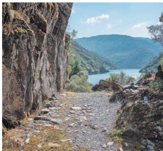
El camino pasa por un singular pasadizo rocoso en Pena Tallada

mando un curioso pasadizo pétreo. Luego el camino inicia un suave descenso y unas decenas de metros más adelante pasa a ser llano hasta llegar a A Cubela, al cabo de 5,8 kilómetros de