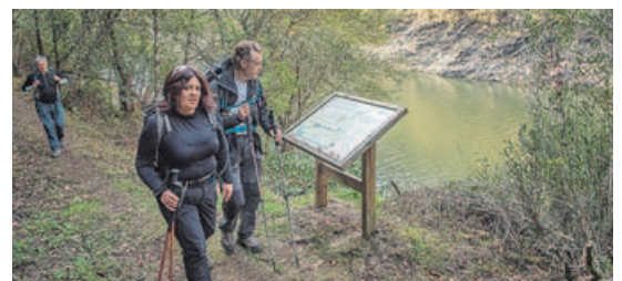
Un panel indicador de la ruta en la orilla del Sil

marcha. La aldea se levanta sobre una antigua explotación aurífera. Sus huellas son unas características tierras rojizas y muchos cantos rodados que se aprovecharon para construir cierres de fincas y