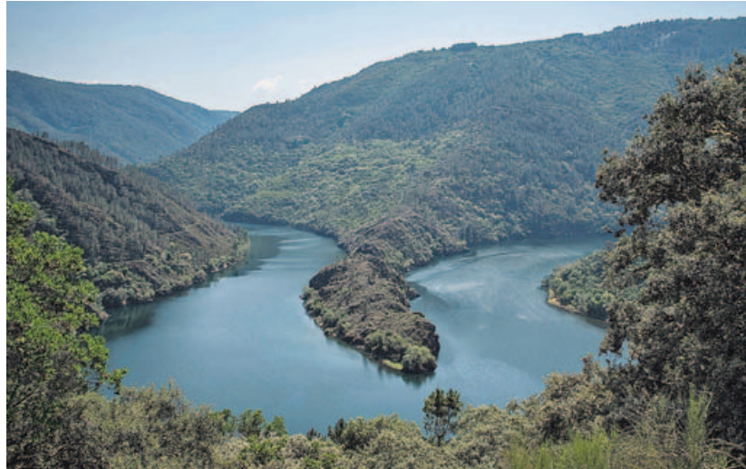
El Sil forma un espectacular meandro a la altura de A Cubela, donde termina la ruta.

En el kilómetro 4,2 el camino se interna en zona boscosa siguiendo el curso del arroyo de Louse-do, que cruzaremos por un puente de madera unos cien metros más adelante. En el último tramo, un kilómetro antes de A Cubela, atravesamos una zona escarpada llamada Pena Tallada, donde la roca fue cortada en dos puntos diferentes del camino, confor-